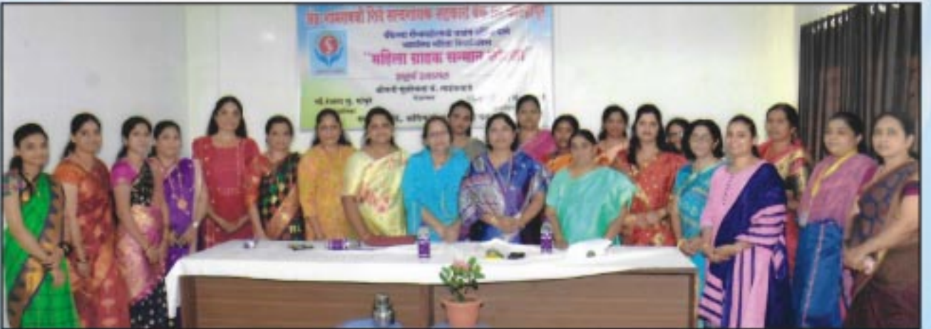
दि. ८ मार्च २०२२ रोजीचे महिला दिनानिमित्त बँकेचे मुख्य कार्यालयात महिला ग्राहक संन्मान सोहळा आयोजित करण्यास उपस्थित महिला व मान्यवर