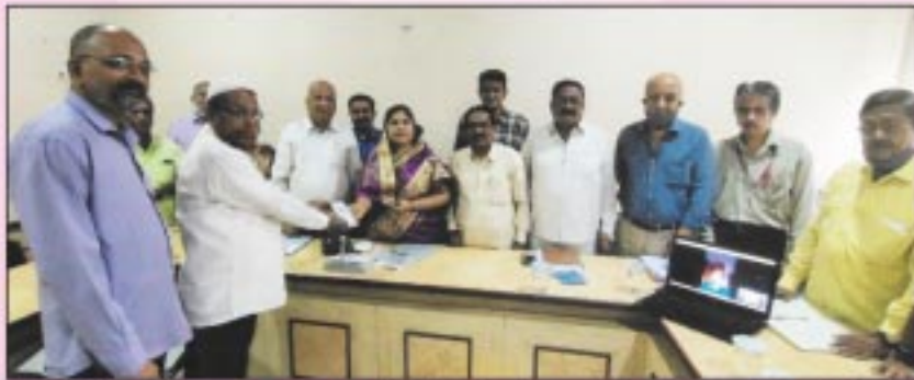
बँकेचे सन २०२०-२१ सालात सातेदारांसाठी QR Code सुविधा कार्यान्वित केली त्याचे अनावरणकामी उपस्थित संचालक मंडळ, ग्राहक व अधिकारी वर्ग.