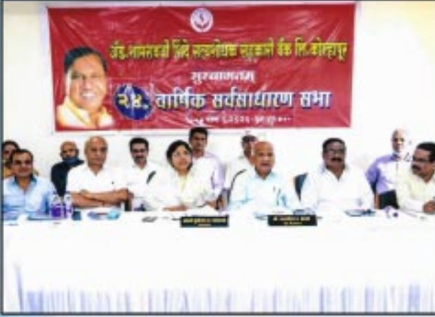
बँकेचे सन २०२०-२१ सालातील २४ व्या वार्षिक सभेस उपस्थित संचालक मंडळ