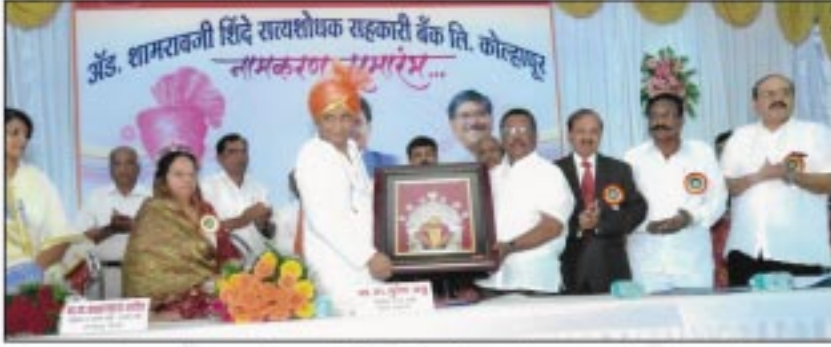
बँकेचा नामविस्तारीकरण सोहळा केंद्रीय रेल्वेमंत्री मा. सुरेश प्रभू यांचे हस्ते करणेत आला, त्यावेळी श्री महालक्ष्मी प्रतिमा भेट देताना चेअरमन व इतर मान्यवर.