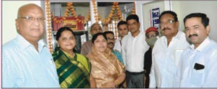
बँकेचे सन २०२०-२१ मधील स्वमालकीचे डाटा सेंटर उदघाटनप्रसंगी उपस्थित संचालक मंडळ