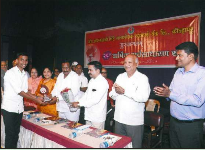
सन २०२१-२२ वार्षिक सभेत विद्यार्थ्यांना पारितोषिक वितरण समारंभ सोहळा उपस्थित संचालक