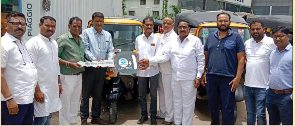
बँकेने ग्राहकांना रिखा खरेदीसाठी अर्थसहाय्य व वाहन डिलीव्हरी वेळी बँकेचे चेअरमन, संचालक व पदाधिकारी