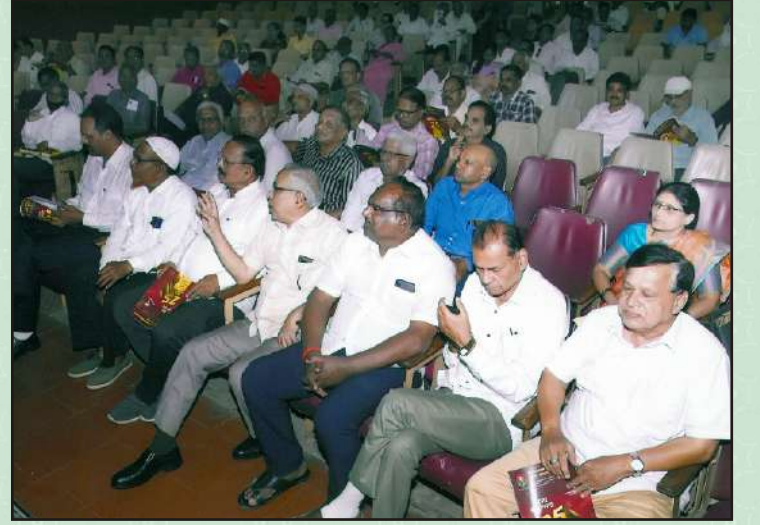
सन २०२१-२२ वार्षिक सभा उपस्थित सभासद वर्ग