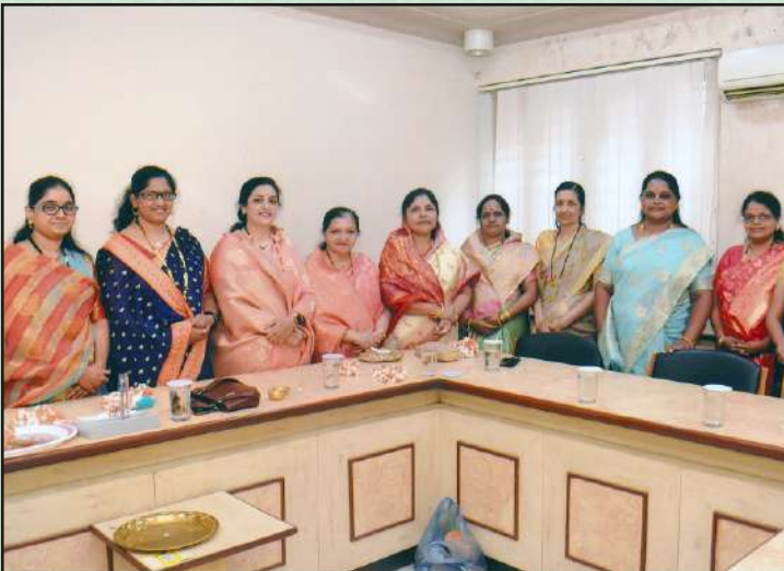
महिला दिनानिमित्त आयोजित कार्यक्रमास उपस्थित मान्यवर व संचालिका कर्मचारी इ.