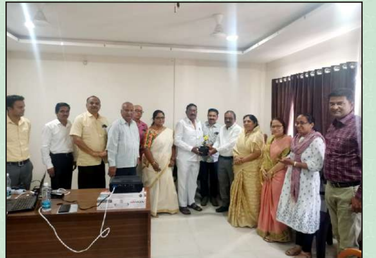
बँक प्रशिक्षण कार्यशाळेस उपस्थित मान्यवरांचे स्वागत करताना संचालक व अधिकारी वर्ग