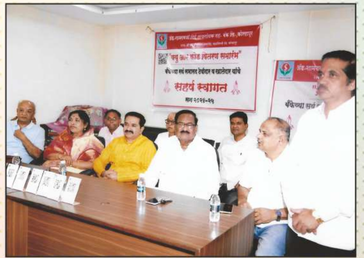
बँक खातेदारांना क्यु आर कोड वितरण समारंभप्रसंगी उपस्थित संचालक मंडळ व अधिकारी