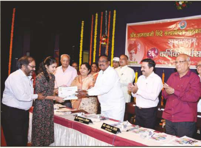
सन २०२२-२३ वार्षिक सभेत विद्यार्थ्यांना पारितोषिक वितरण समारंभ सोहळा उपस्थित संचालक