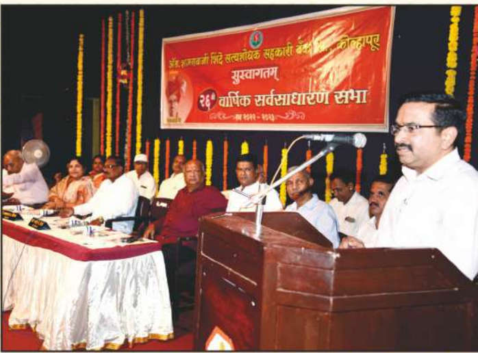
सन २०२२-२३ वार्षिक सभेचे समारोप भाषण करताना व्हा. चेअरमनसो