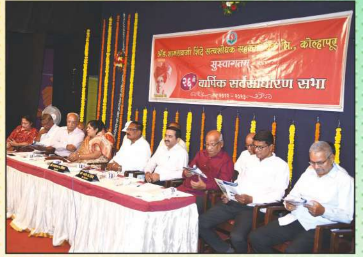
सन २०२२-२३ वार्षिक सभेस उपस्थित संचालक मंडळ