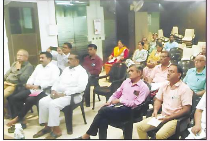
बँक संचालक व सेवक संयुक्त प्रशिक्षण आयोजित कार्यशाळेसमयी हजर संचालक व सेवक वर्ग