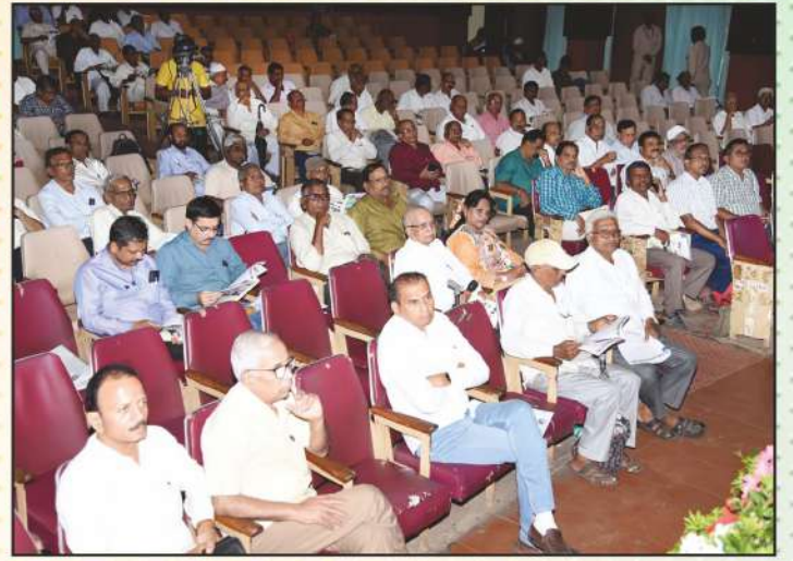
सन २०२२-२३ वार्षिक सभा उपस्थित सभासद वर्ग