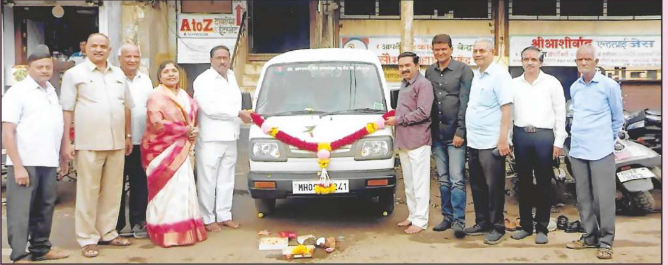
बँकेने खरेदी केलेले स्वमालकीचे वाहन पुजन करताना उपस्थित संचालक मंडळ व अधिकारी वर्ग